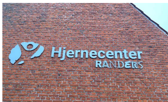
Hjernecenter Randers er en af arbejdspladserne, hvor vi har en mindre gruppe medlemmer

Vi har godt samarbejde med alle tillidsrepræsentanterne, hvilket vi sætter stor pris på i det daglige arbejde for alle vores medlemmer i Randers Lærerforening.