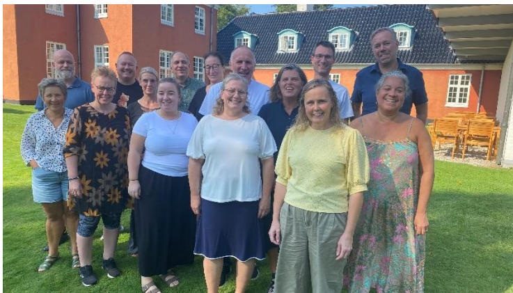
Tillidsrepræsentanter på kursus

Vi vil gerne takke alle arbejdsmiljørepræsentanter for indsatsen gennem hele 2024.