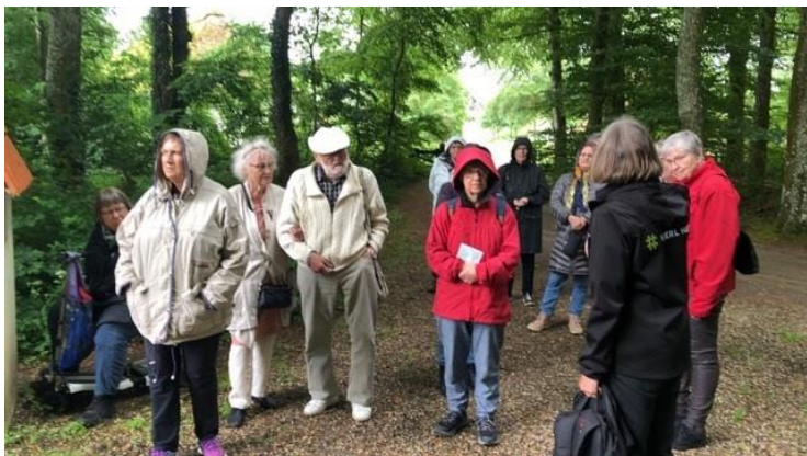
Fra turen til Hjerl Hede

Pensionisterne har gennem 2024 afholdt mange interessante arrangementer med stor deltagelse. Arrangementerne har haft stor spændvidde, fra byvandring i Randers, besøg på Randers Teater, en tur til Hjerl Hede og Kongenshus for at slutte af med en velplanlagt juleafslutning på Restaurant Skovbakken.