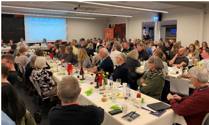
Fra den velbesøgte generalforsamling

14. marts afviklede Randers Lærerforening valggeneralforsamling. Ca. 200 kolleger var samlet på Tradium for at høre om Styrelsens arbejde, folkeskolens og andre arbejdspladsers udvikling og udfordringer i Randers kommune, og valg til styrelsen.